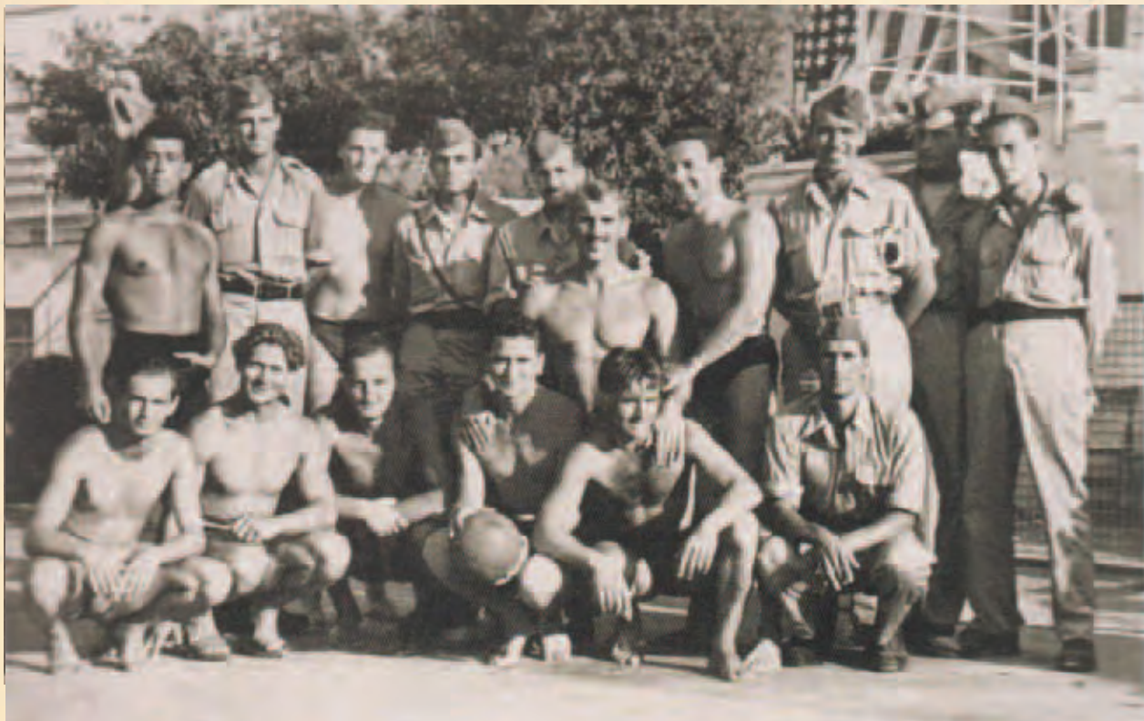
Partizani – športaši koji su bili prvi emisari Nove Jugoslavije na savezničkom natjecanju u plivanju i vaterpolu u Rimu 1944.

Grupa mornara iz Četvrtog pomorskog sektora redovno je, u slobodno vrijeme, igrala vaterpolo tijekom ljeta 1944. Lopte su se nabavljale u talijanskim gradovima